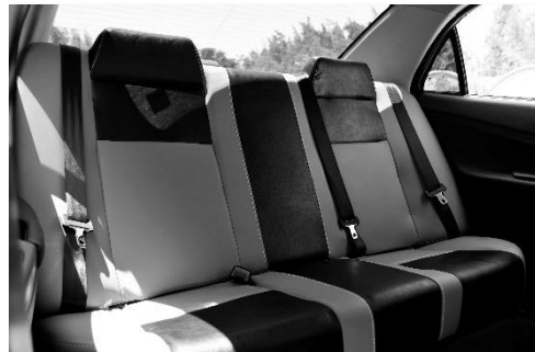
كراسي خلفية تتسع لثلاث ركاب