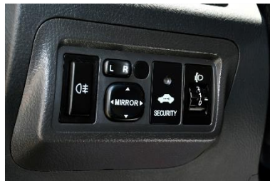
نظام إيموبيليزر - فوانيس شبورة - مرايات جانبية كهربائية