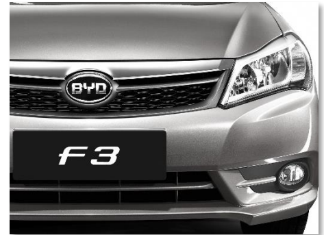
شبكة أمامية كروم ذات تصميم عصري