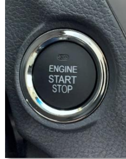
نظام المفاتيح الذكي (مفتاح بصمة)