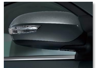
إشارات بالمرايات الجانبية