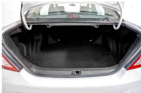
مساحة خلفية واسعة