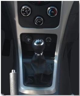
ناقل حركة يدوي

راديو / USB / مدخل صوت خارجي AUX - تكييف هواء - باور ستيرنج - عجلة قيادة قابلة للتعديل