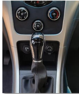
ناقل حركة أوتوماتيك