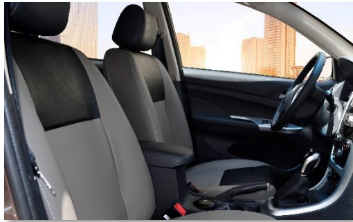
كراسي أمامية قابلة للتعديل