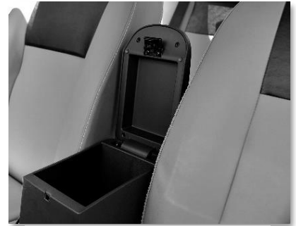
مخدع يد مزود بصندوق تخزين