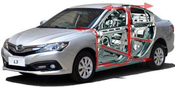
دعامات فولاذية بالأبواب