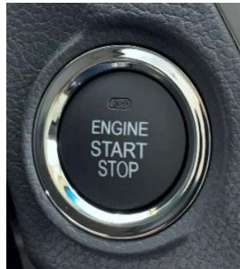
نظام تشغيل بدون مفتاح