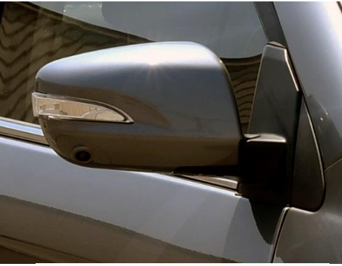
إشارات بالمرائيات وكاميرا بالجانب الأيمن