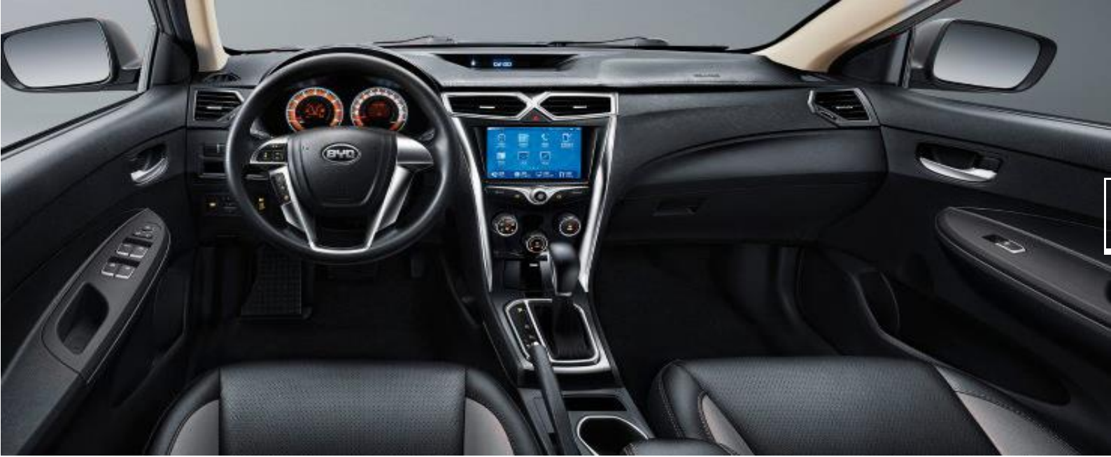
شاشة وسائط متعددة بمدخل صوت خارجي Bluetooth-USB-AUX - تكييف هواء - باور ستيرنج - عجلة قيادة قابلة للتعديل