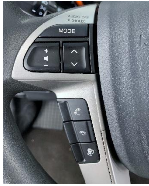
عجلة قيادة متعددة الوظائف