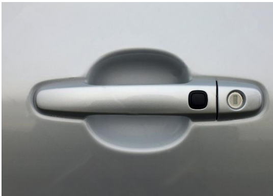
نظام المفتاح الذكي - مفتاح بصمة