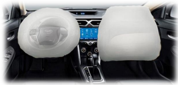
اكياس هواء ذكية للسائق والراكب الأمامي