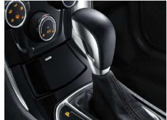
ناقل حركة أوماتيكي