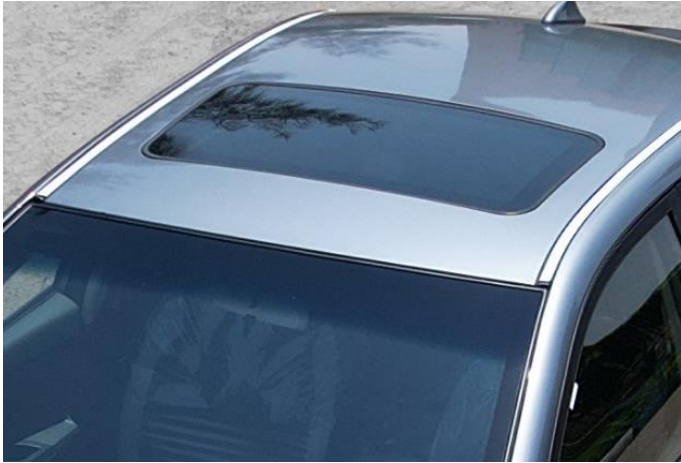
فتحة سقف كهرباء