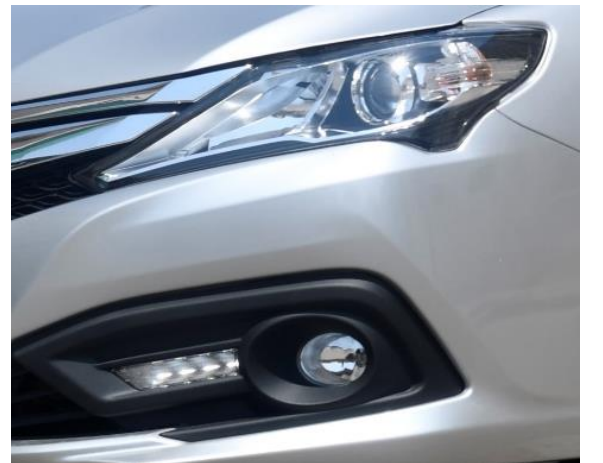
إضاءة نهائية - فوانيس شبورة