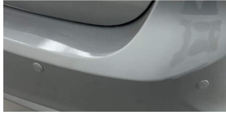
نظام المساعدة على الركن حساسات خلفية - كاميرا خلفية